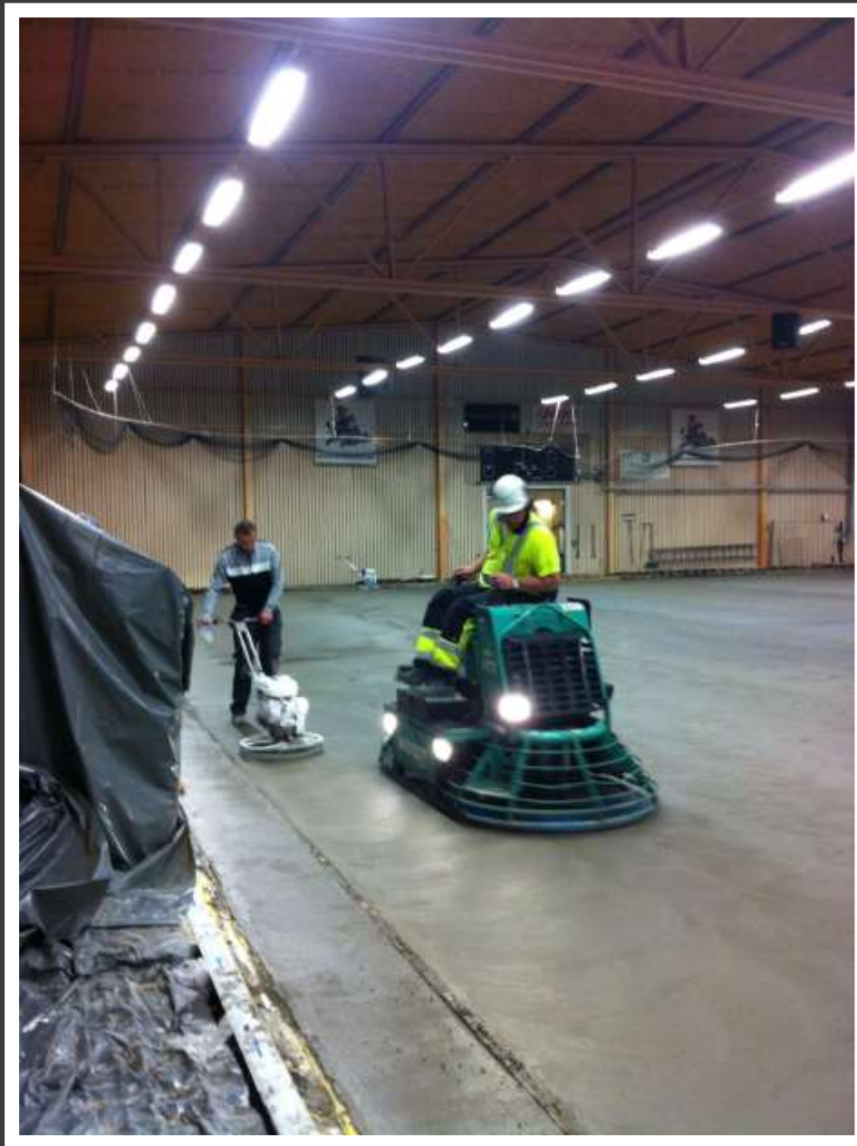
Slipning av ytan