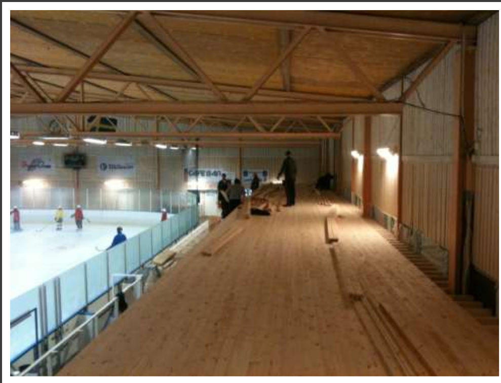
Golvläggning på läktaren.