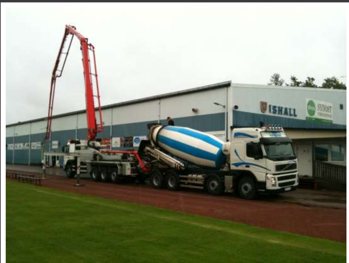
Pumpbil och cementbil från Högsbybetong.