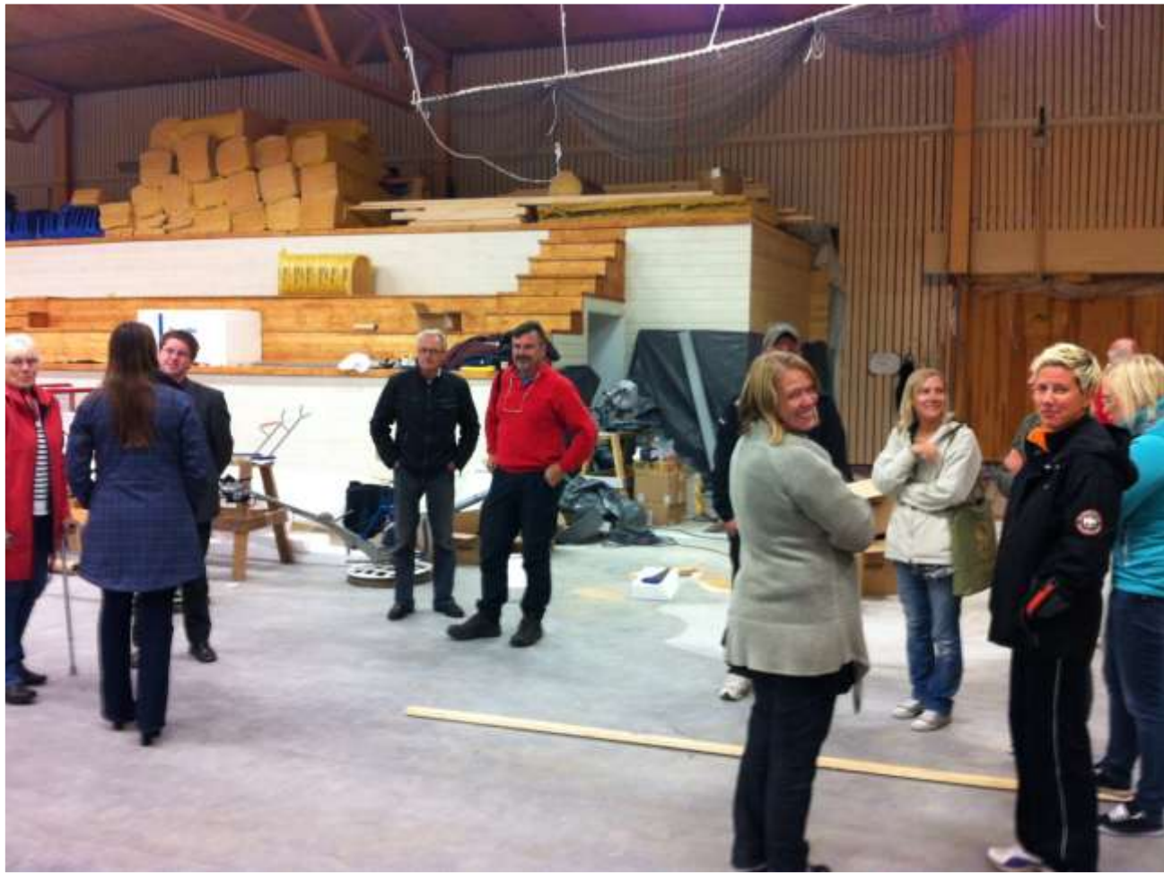
Centern i Uppvidinge på besök med LIF styrelsen.