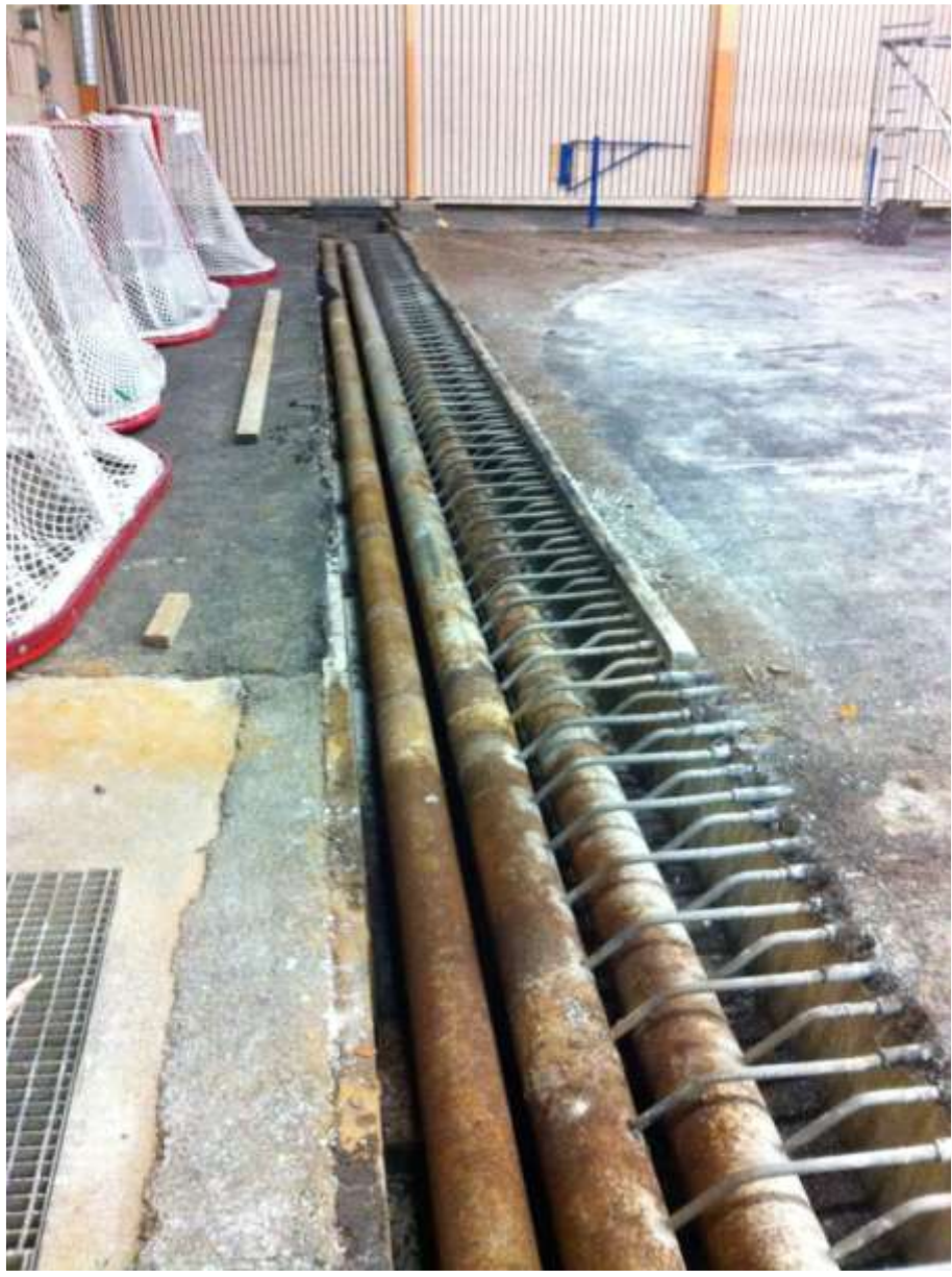
Gamla kylslingor med saltlösning demonteras