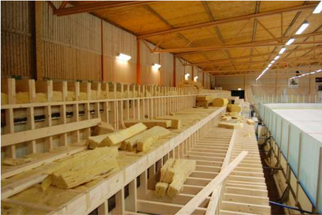
Isolering på plats.