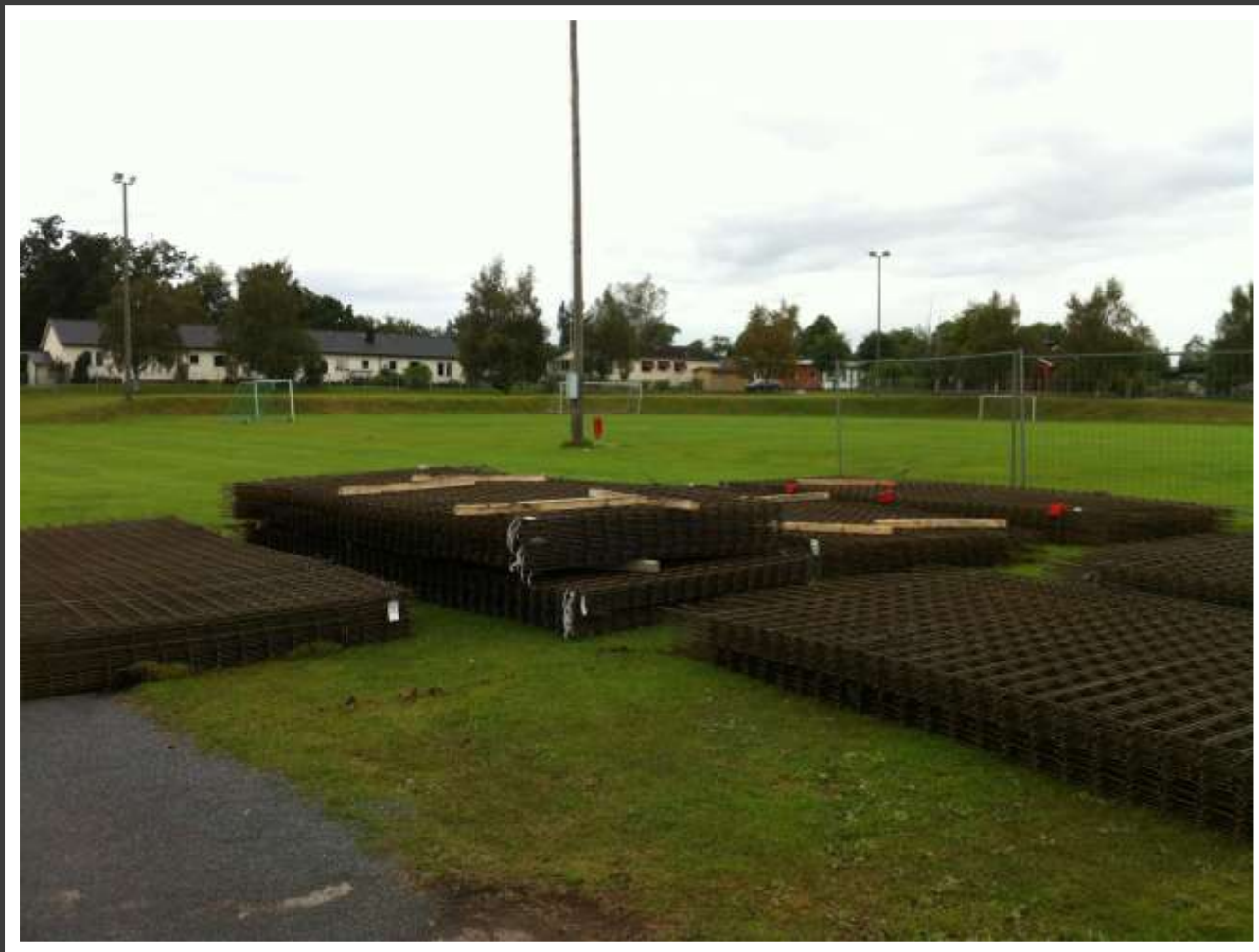
335 Armeringsmattor ska läggas på plats