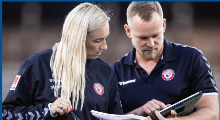
Mindre belastning för individen