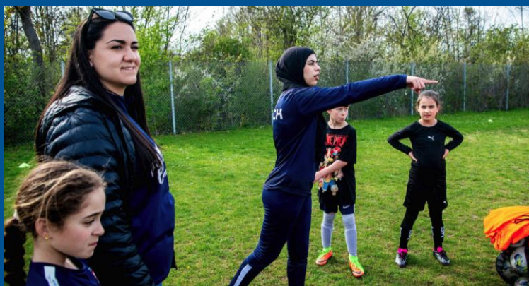
Förstärka gemensamma budskap