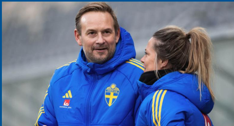
Motivationshöjande att jobba ihop