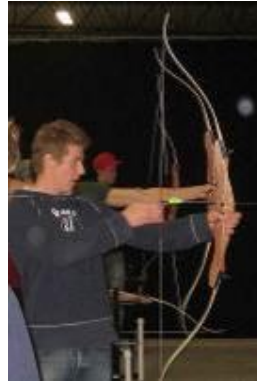
Skytte i Sävsjö som avslutning på säsongsupptakten