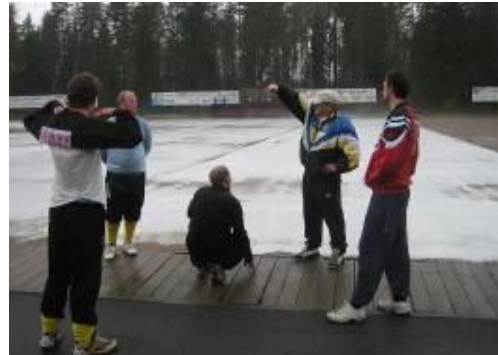
Barmarksträning i Åby