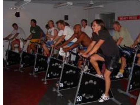
Spinning – uppskattad träning under försäsongen