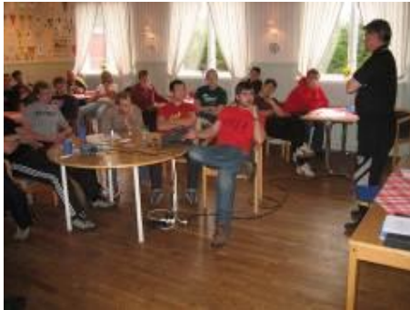
Säsongsupptakt 5 november -