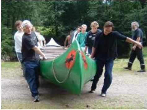
Kanot - försäsongsupptakt i augusti