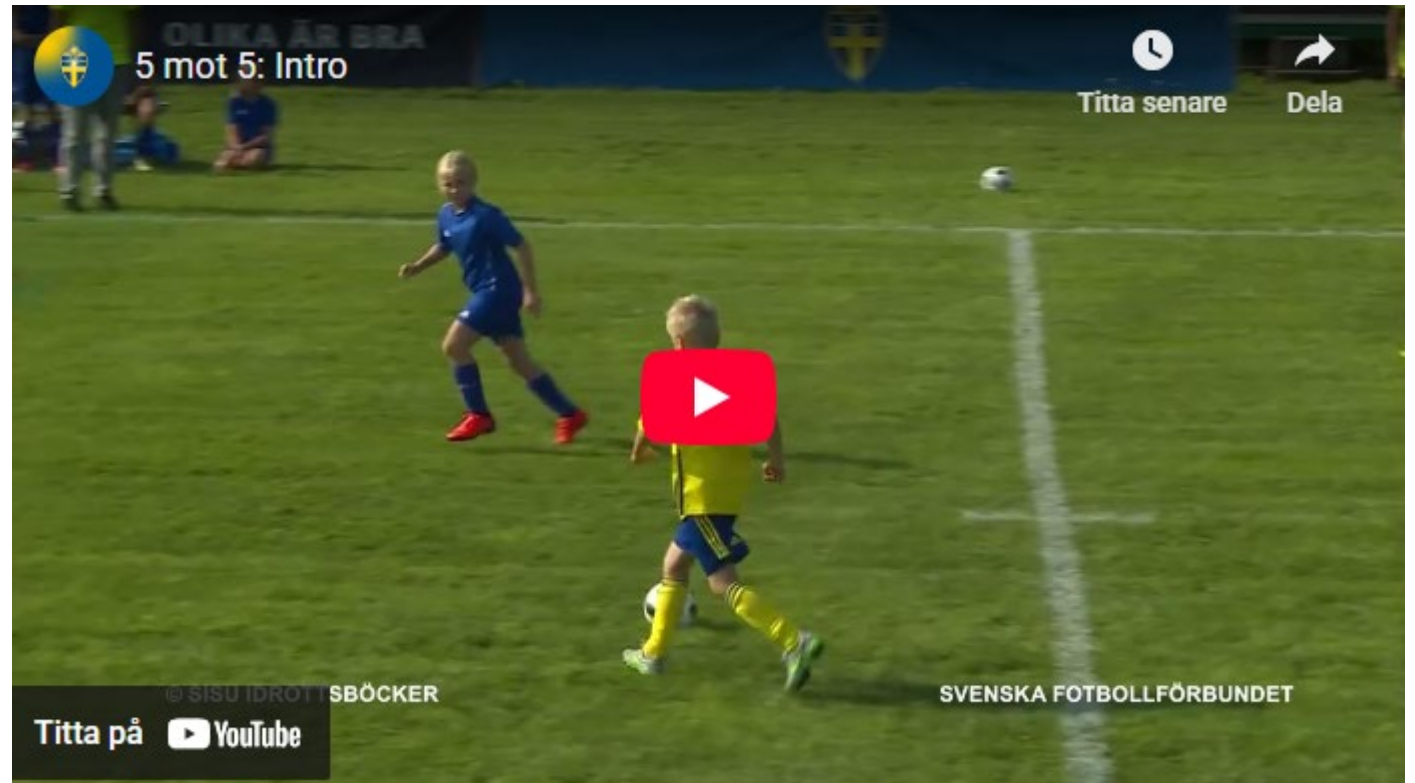
5 mot 5: Intro