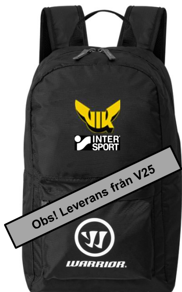
Core Backpack COREBP3