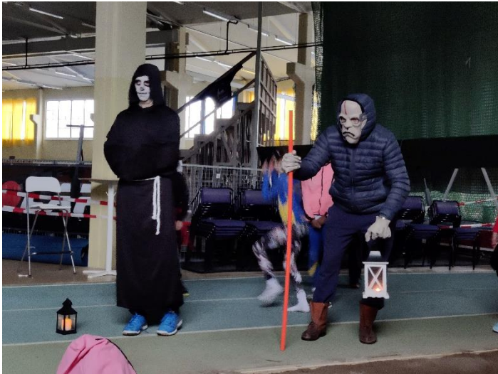
Ett monster och "ledsagaren"