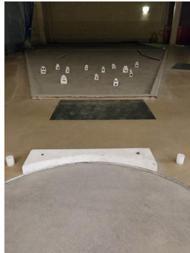
13 onda småspöken