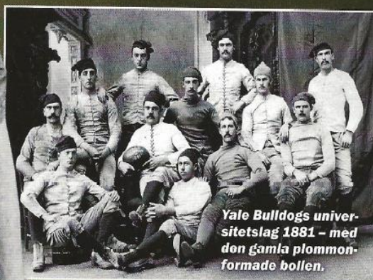
Yale Bulldogs universitetsslag 1881 – med den gamla plommonformade bollen.