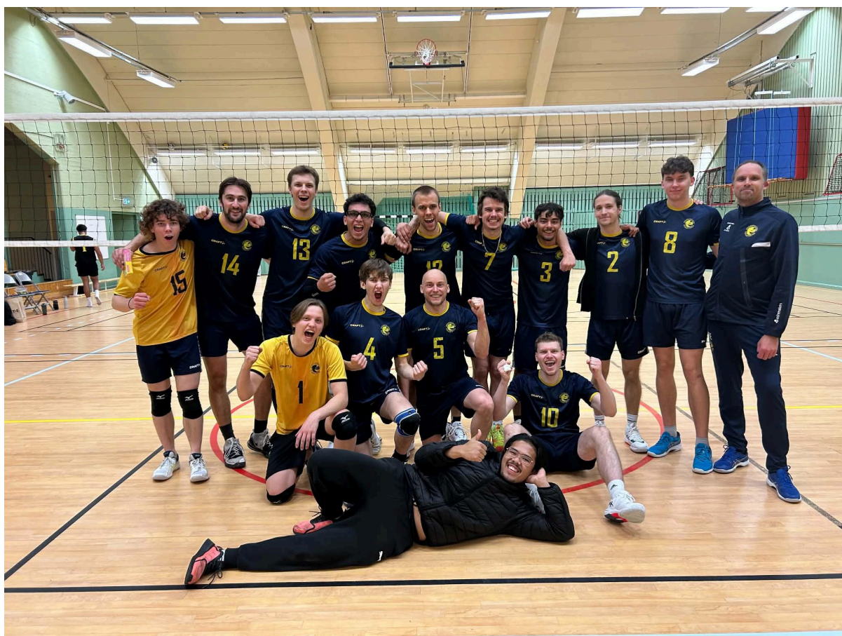
Bild 4 - Herrlaget efter ett starkt hemma sammandrag i oktober 2025.