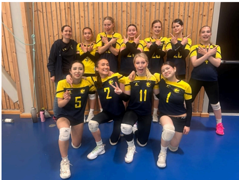
Bild 3 - Damlaget efter en andra plats i B-slutspelet på Öppna SM