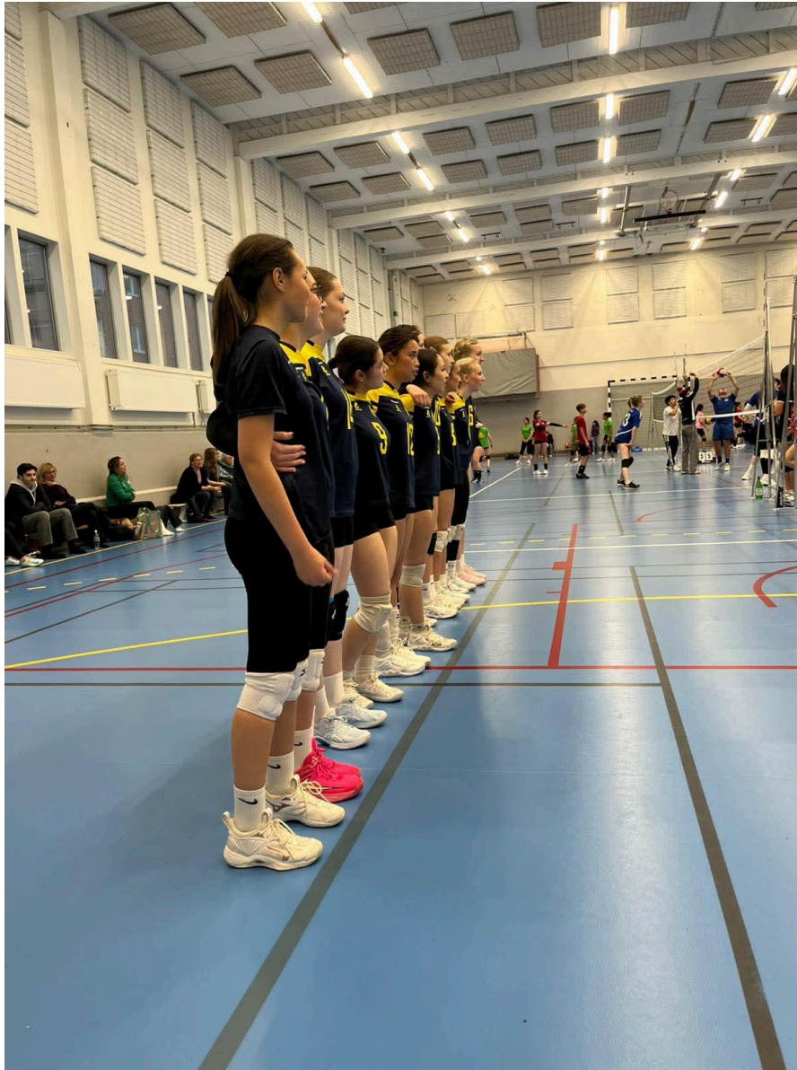
Bild 1 - Damlaget på tävling

Bilder från verksamhetsåret som har varit