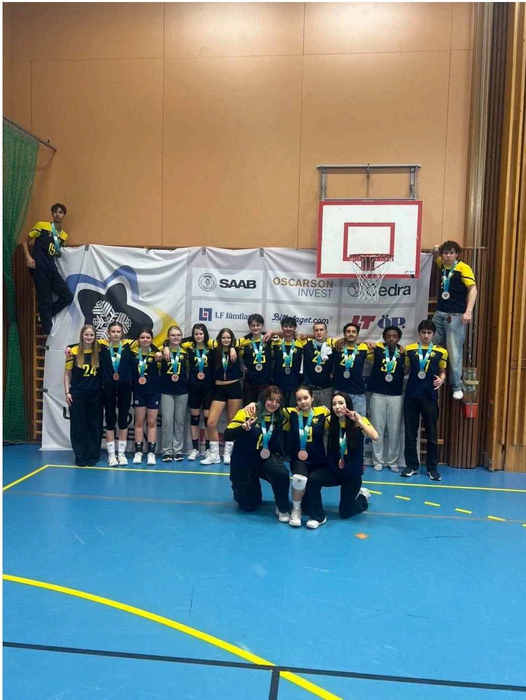
Bild 2 - Våra duktiga ungdomar på nordiska ungdomsspelen