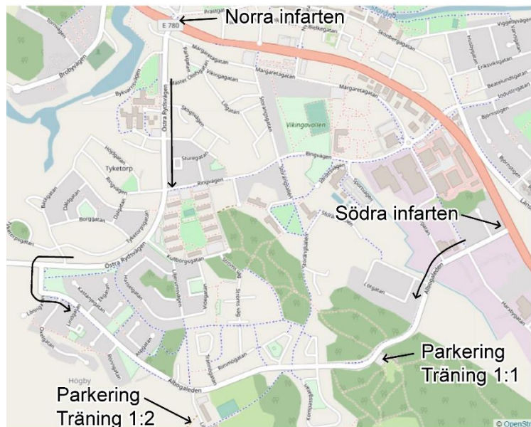
Vägvisning i Söderköping