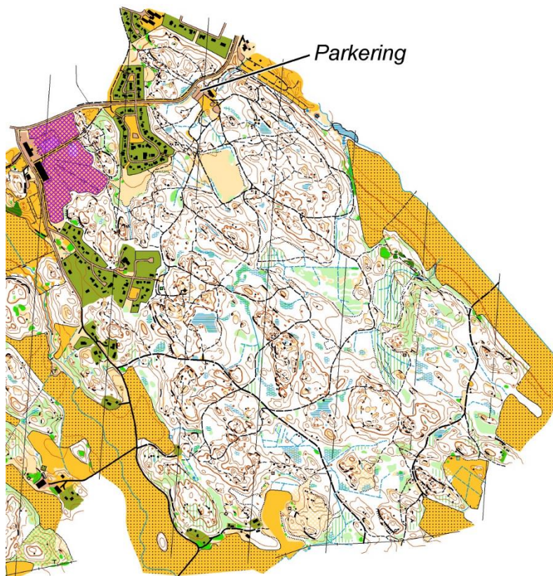
Del av karta Skogshem. Ny ritad november 2020.