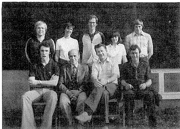
SAIF:s styrelse 1981-81.