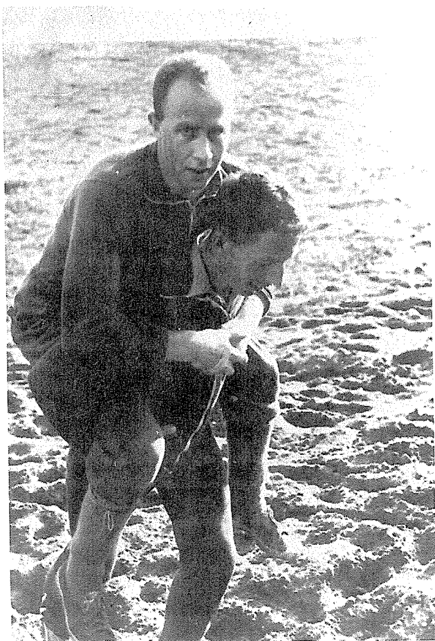
Konditionsträning i Sunnerstagopen på 1950-talet.

Föreningens ekonomi är för närvarande svag, några kontanta tillgångar finnes icke nämnvärt, men vi ha ej heller några skulder. Om man erinrar sig allt, vad föreningen måst inköpa och påkosta, våga vi dock påstå, att föreningens ekonomiska ställning efter den korta tid den existerat ändå icke är så dålig.