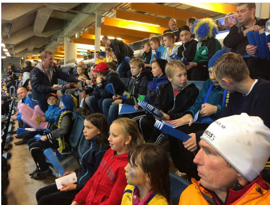
Arrangemang: Fotbollsresa EM-kval herrar