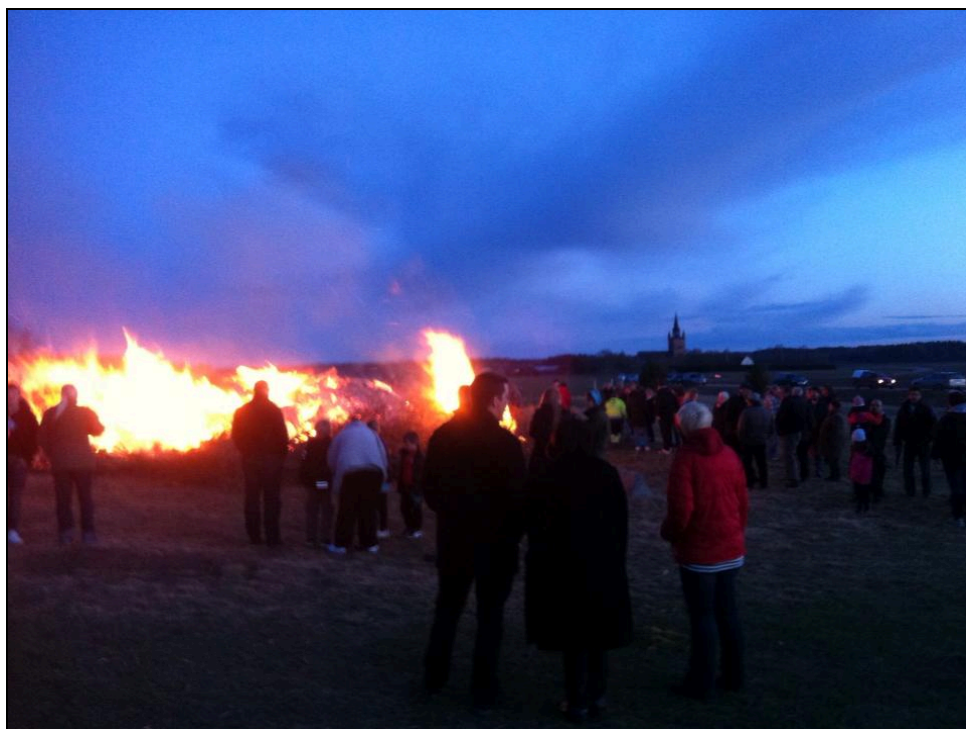
Arrangemang: Valborg 2014