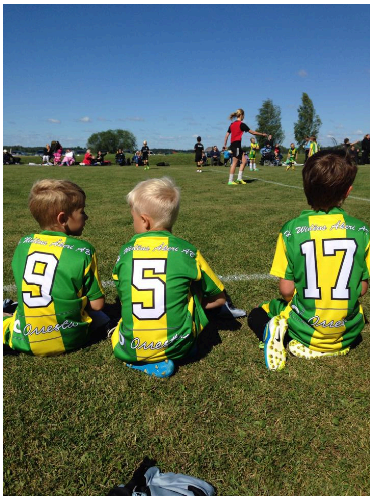
Fotboll: Pojkar P06