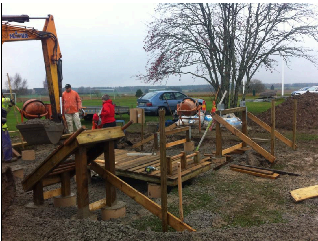
Utvecklingsprojektet OIP – montage utegym