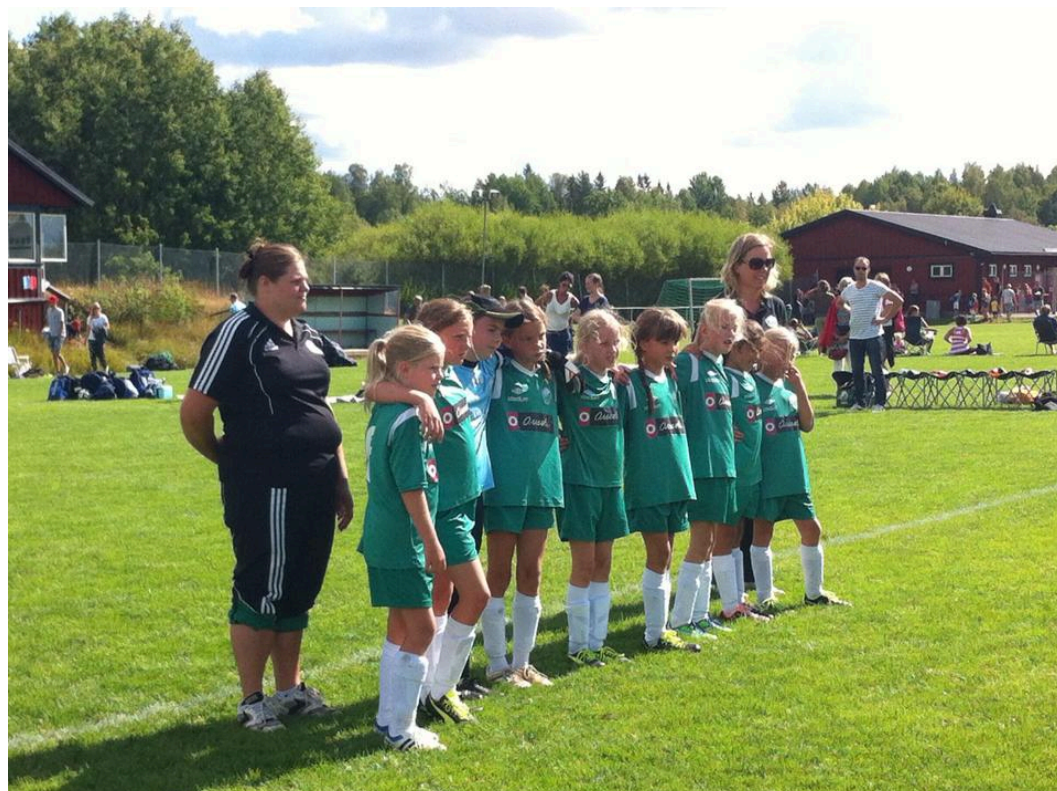
Fotboll: Flickor 04