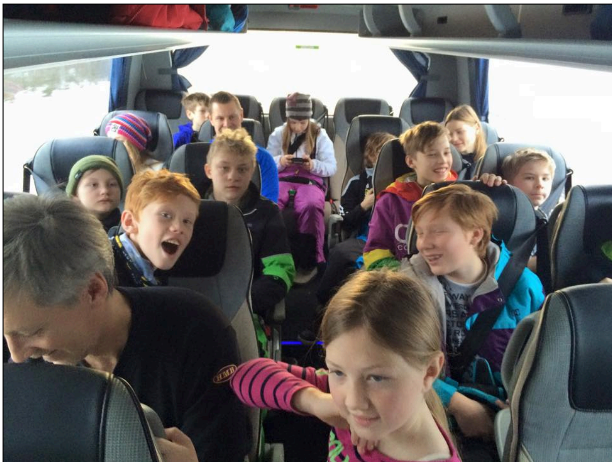
Arrangemang: Skidresa till Romme Alpin (planerades 2014, genomfördes 2015)