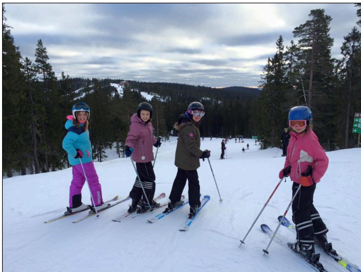
Arrangemang: Skidresa till Romme Alpin (planerades 2014, genomfördes 2015)