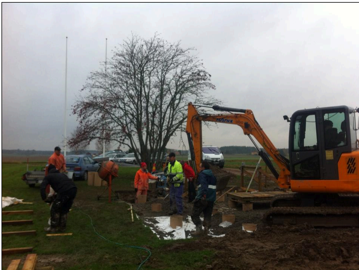
Utvecklingsprojektet OIP – markarbeten utegym