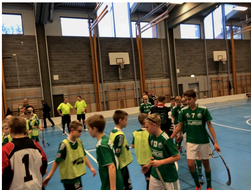
Innebandy: Pojkar P01