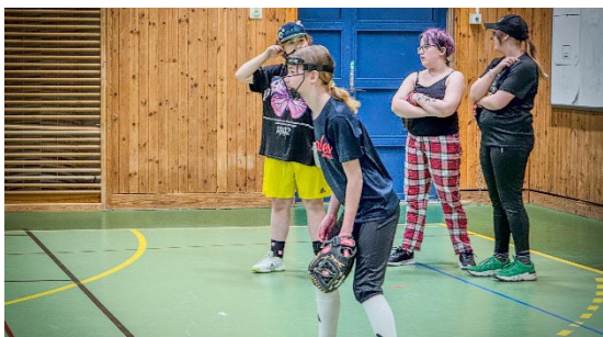
Årets första Girls at Bat i Örebro.