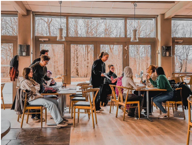
Årsmöte på Naturens hus som avslutades med en god lunch.

Föreningens årsmöte genomfördes den 9 mars på Naturens hus och avslutades med en gemensam lunch