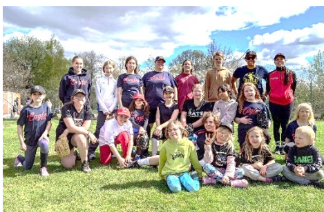
Årets andra Girls at Bat hölls även det i Örebro med stor deltagande från Eagles.