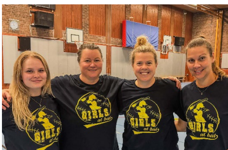
Årets sista Girls at Bat var ett övernattningsläger i Leksand