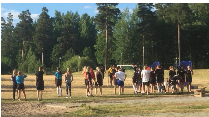
Prova på med Kumla innebandy

Klubben visade upp sporten tillsammans med Kumla Innebandy som bjöd in till en dag för sina medlemmar, och klubben har haft kastteknikträning med två målvakter från en annan innebandyörening i Örebro.