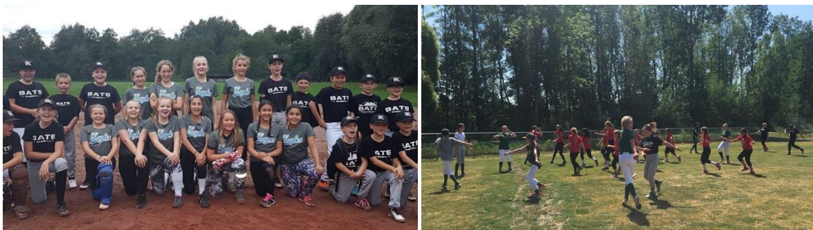
Träningsmatch mellan Eagles och Bats, U13-turnering i Enköping

Klubbens U13-lag deltog i en turnering i Enköping och tog även emot Karlskoga Bats för en match där man mixade baseball & softball på hemmaplan.