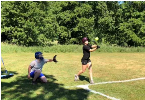
Slowpitchturnering i Åbyparken

Föreningen har under året arrangerat en rad olika sociala aktiviteter för att bygga en bra sammanhållning i klubben. Spelarträffar med verksamhetsutveckling, mat & spel, grilldag på planen, middagar med våra amerikanska spelare, seniorkvällar, slowpitchturnering mm.