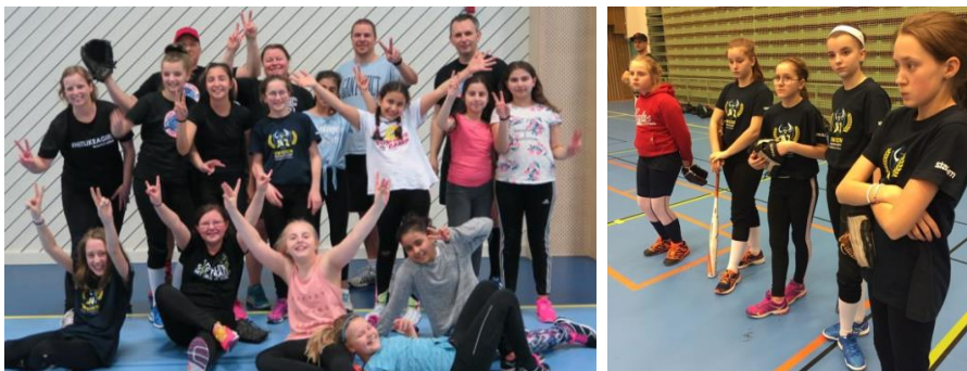
U13-läger i Lanna och ungdomsdag i Skövde

Föreningen har arrangerat ett U13-läger tillsammans med Lekeberg Lizards och även varit på ungdomsdag i Skövde.