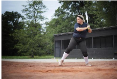
Träningsmatch i Ballonghallen i Vivalla, och softballträning i Åbyparken.

Föreningen har under verksamhetsåret haft träningsverksamhet för seniorer, juniorer (14-19 år) och ungdom (U13 år). Seniorerna har tränat två till tre gånger i veckan, juniorerna har tränat både tillsammans med seniorerna samt haft två separata träningstider per vecka under sommaren och ungdomarna har tränat två gånger per vecka under sommaren och en gång per vecka under hösten/vintern.