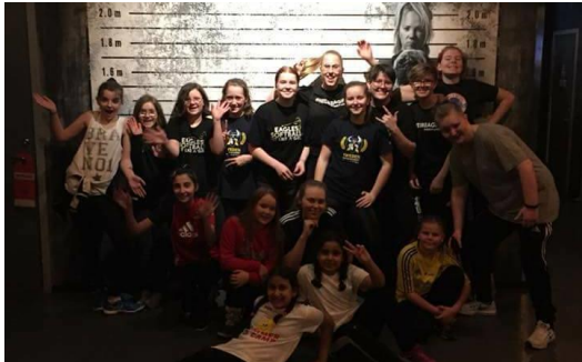
Ungdomssektionen på Prisson Island

Föreningens ungdomssektion som har haft 4 st. möten. Ungdomssektionen har arrangerat en ungdomsträff på Prisson island.