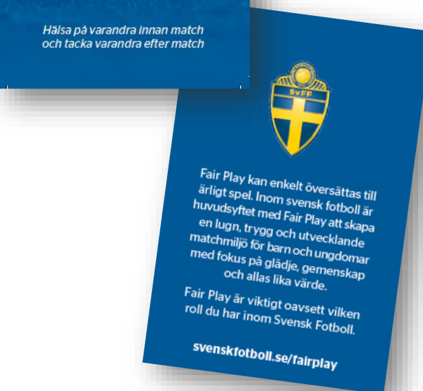
Visitkort att printa och dela ut vid match/cuper