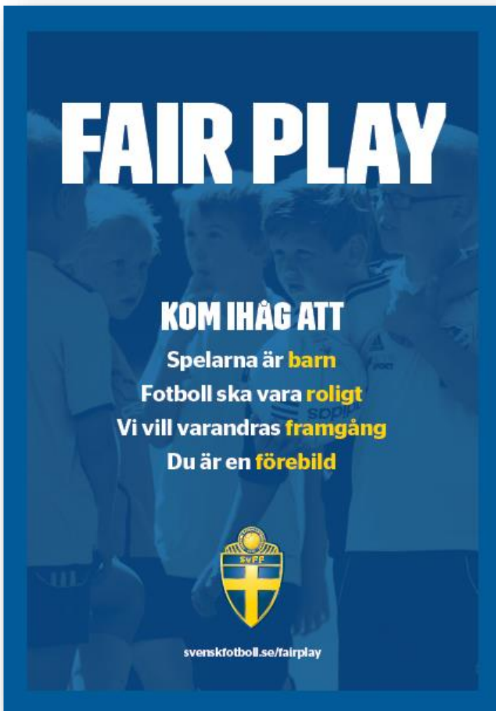
Planch att sätta upp på anläggningarna.