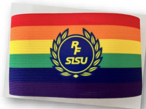
Lagkaptensbindel lagen kan få att använda efter ett Fair Playarbete i laget