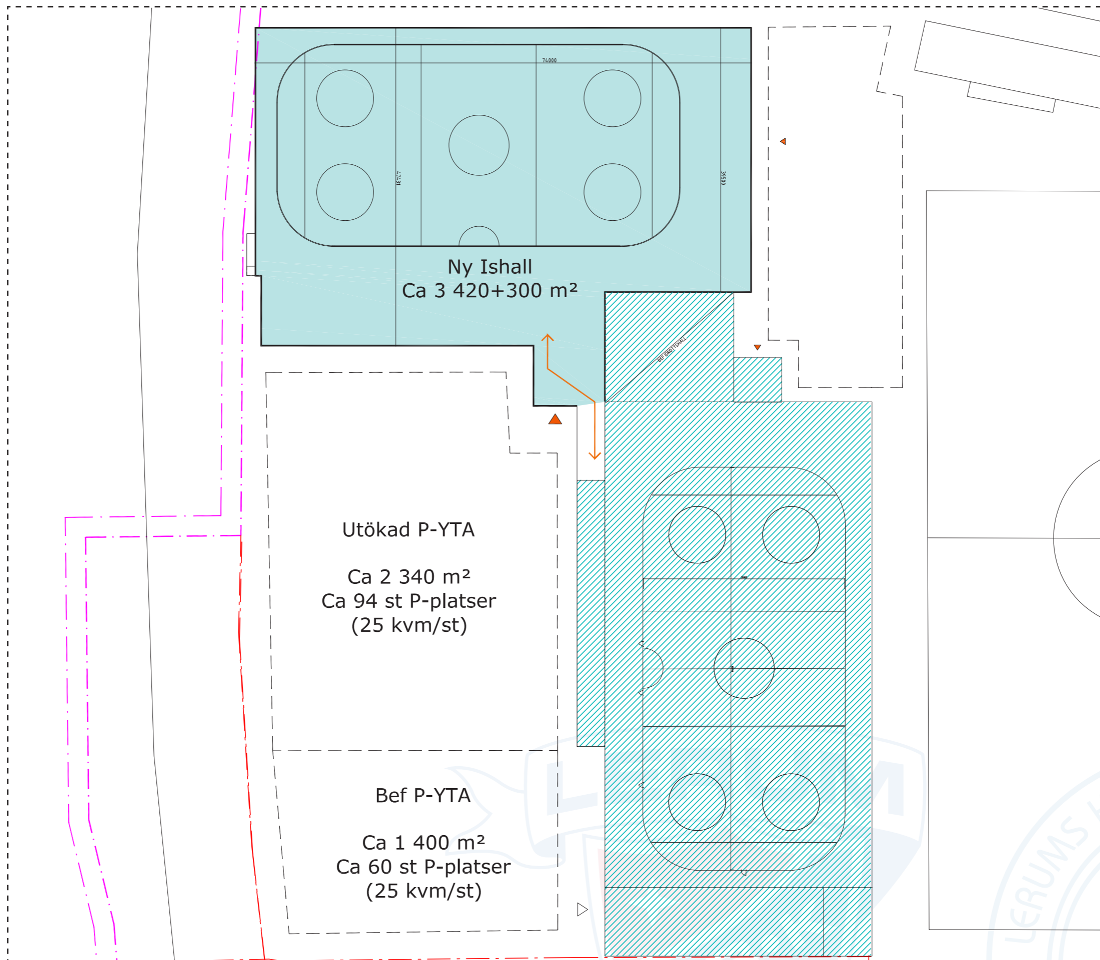
Disposition 1:500 A:3