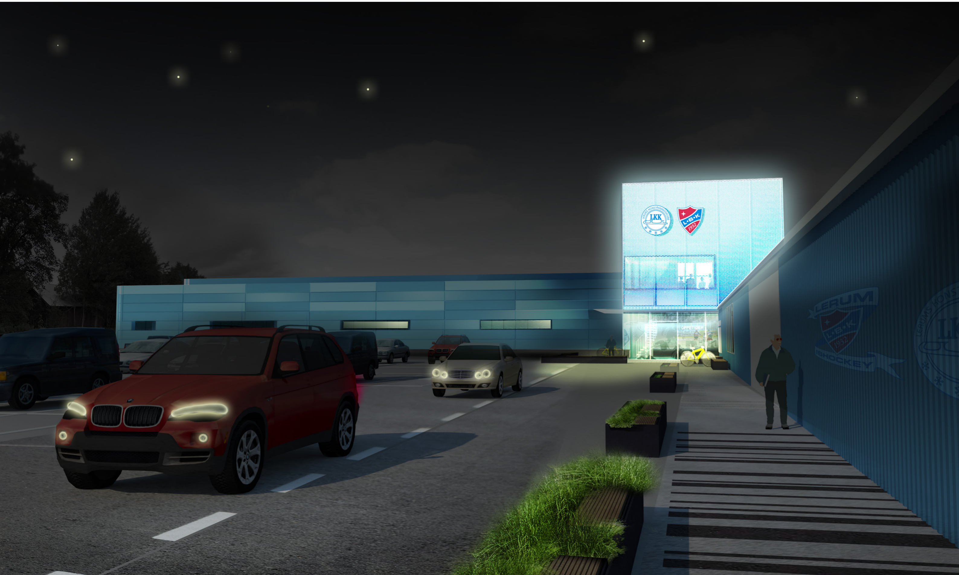
VÄTTLEHALLEN 2.0 (ISKUBEN)