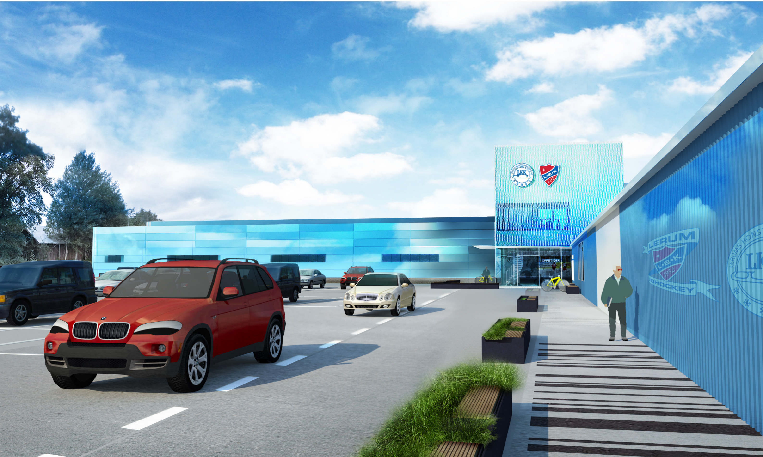
VÄTTLEHALLEN 2.0 (ISKUBEN)