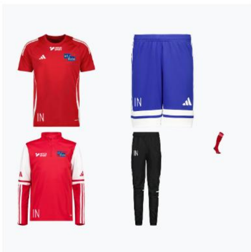
Stora Träningspaketet Barn