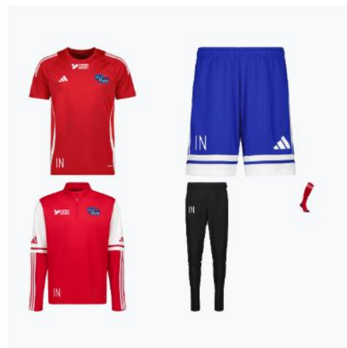
Stora Träningspaketet Herr