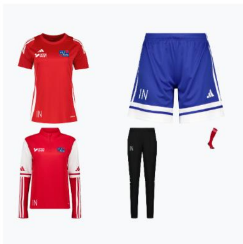
Stora Träningspaketet Dam