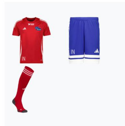
Lilla träningspaketet Barn