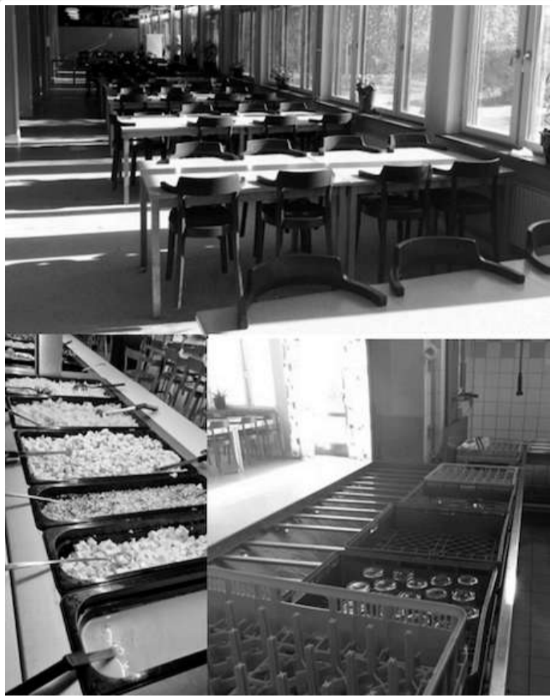
Matsal med buffé och diskstation

I Sverige äter skolungdomar tillagad varm lunch varje dag. Tack vare stöd från de lokala kommunerna kan vi servera hälsosamma, varma måltider på skolorna. Måltiderna serveras som buffé. Det är bättre att ta en mindre portion från början och sedan hämta mer mat vid behov än att slänga häften. Efter maten ska du städa bordet och ställa disken i diskområdet. Alla hjälps åt att hålla matsalen ren och trevlig. Läs mer om att äta i en matsal här ( //support-se.gothiacup.se/article/151-att-ata-pa-skola ).