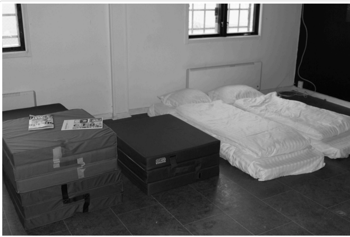
Gothia Cups madrasser

Vissa större klubbar bor i idrottshallar. Dessa erbjuder mer utrymme men kan vara bullrigare eftersom flera lag delar hallen.