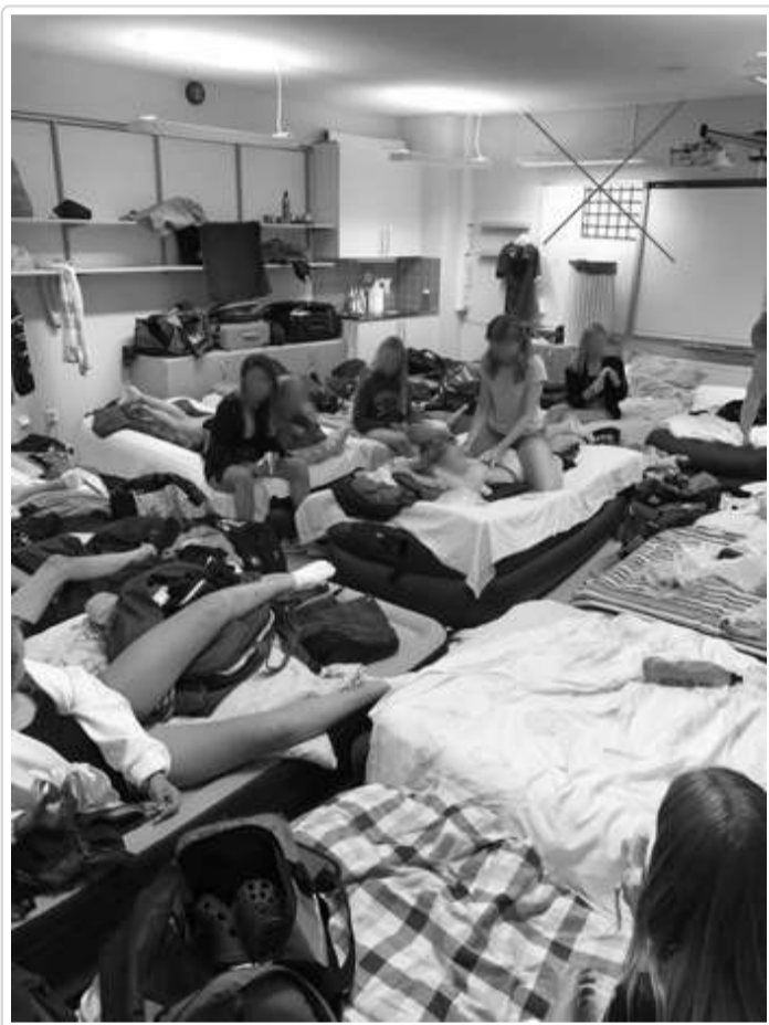
Exempel på för breda madrasser

Det finns inte mycket plats i klassrummen, så det krävs planering och samarbete för att det ska fungera smidigt.