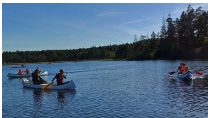
Hasse Hansa avslutning

Tack övriga idrottsklubbar och företag som villigt lånar ut sina anläggningar, utrustning och stora kunskap för att IF Hansa-Hoburg ska kunna erbjuda barnen på södra Gotland ett varierande utbud av aktiviteter inom ramen för Hasse Hansa. Under 2025 har vi fått stöd av Sudrets HC, Hablingbo IK, Hablingbo fotbollsgolf, Bin, bygg och kanoter i Lojsta, Hulehällar discgolf, Gåsen Out, Stånga IF och Ånggårde. Såklart även ett stort tack till ledare inom IF Hansa-Hoburgs övriga sektioner som även dem bidragit till att barnen fått testa på ett stort utbud av idrotter.