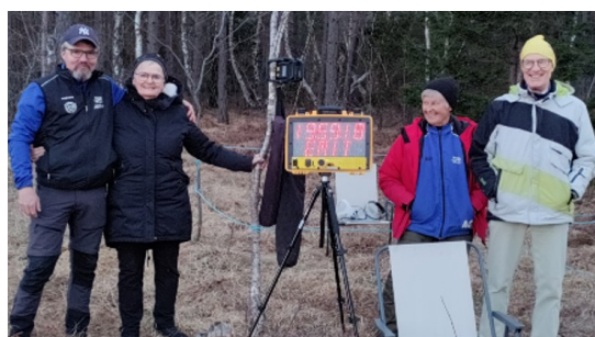
Personal vid starten Natt-DM