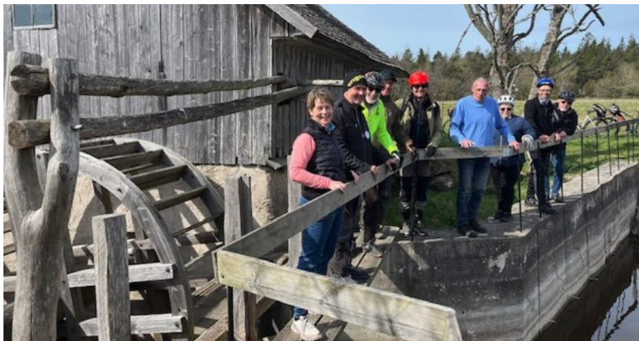
↑ Lillrone vattenkvarn, Stångaturen