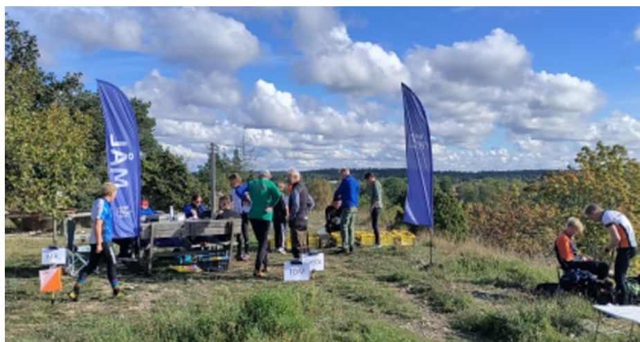
Start och Mål Suderträffen på Lindeberget

Hittaut i Hemse var ett stort arbete att vara med i och hålla koll på att check points var på plats eller sätta ut nya. Många uppskattar arrangemanget vilket blir vårt jobb som projektgruppen gör. Det kommer att bli Hittaut även 2026 i vårt närområde.