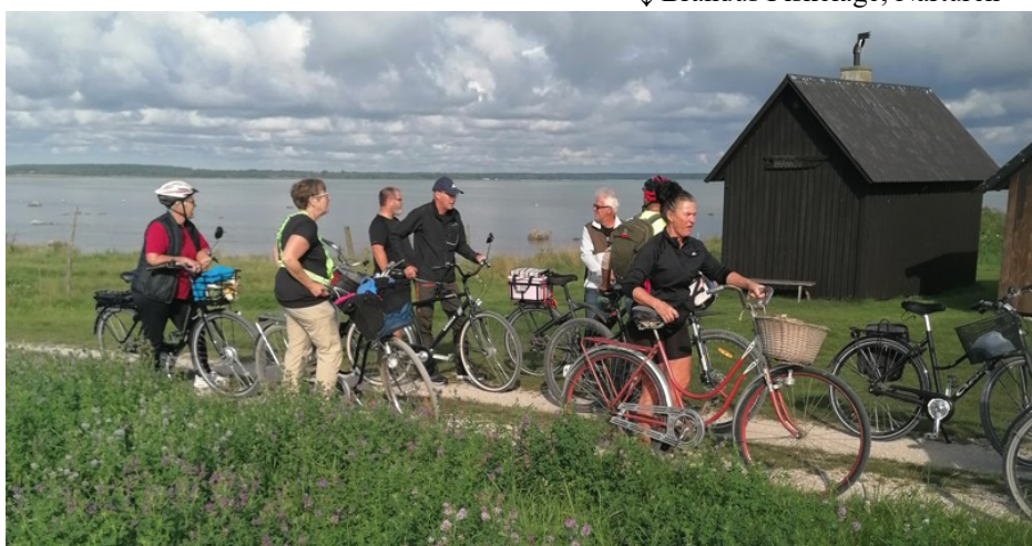
↓ Brändus Fiskeläge, Närturen

7 september startade vi vid När Golfbana. När har väldigt många fiskelägen som haft stor betydelse en gång i tiden. 12 okt blev det Gotland Tvärs från Källdhagen och österut. Fika i fågeltornet vid Stockviken, passade bra denna lite blåsiga höstdag. Vi räknar med att fortsätta i någon form 2026