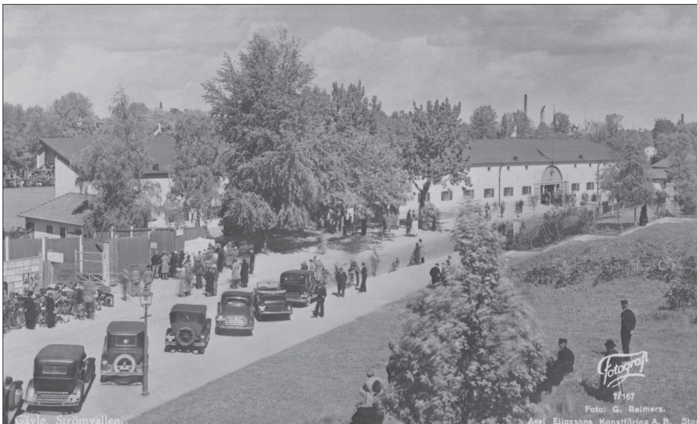
Bilarna radar upp sig på Kungsbäcksvägen utanför Gävles och Sveriges nya idrottsborg – Strömvallen.