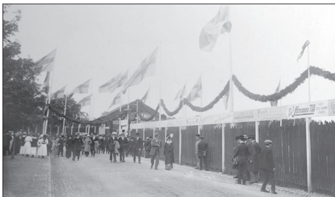
Utanför det som då hette Strömdalen under SM-tävlingarna i friidrott 1915.