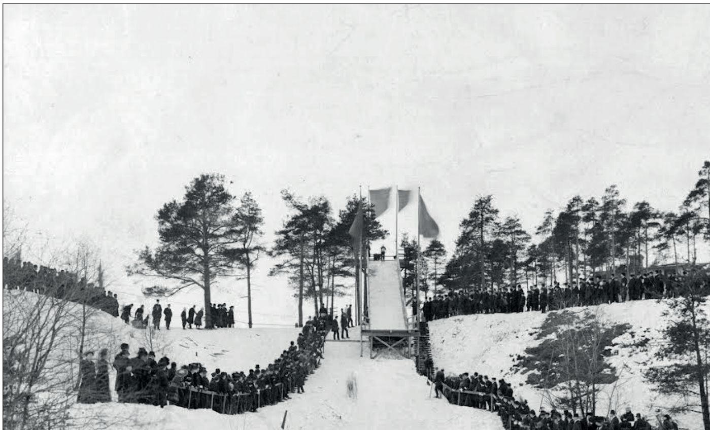
Hoppbacken vid Gustavsbro – på den tid det begav sig.