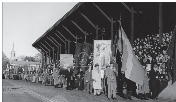
Folkfest och manifestation på Strömvallen.

Så kom yran under Gunder Häggs storhetstid. Världsrekordgala med Gunder Hägg lockade 9 333 åskådare till Strömvallen 1942, vilket förblivit publikrekord.