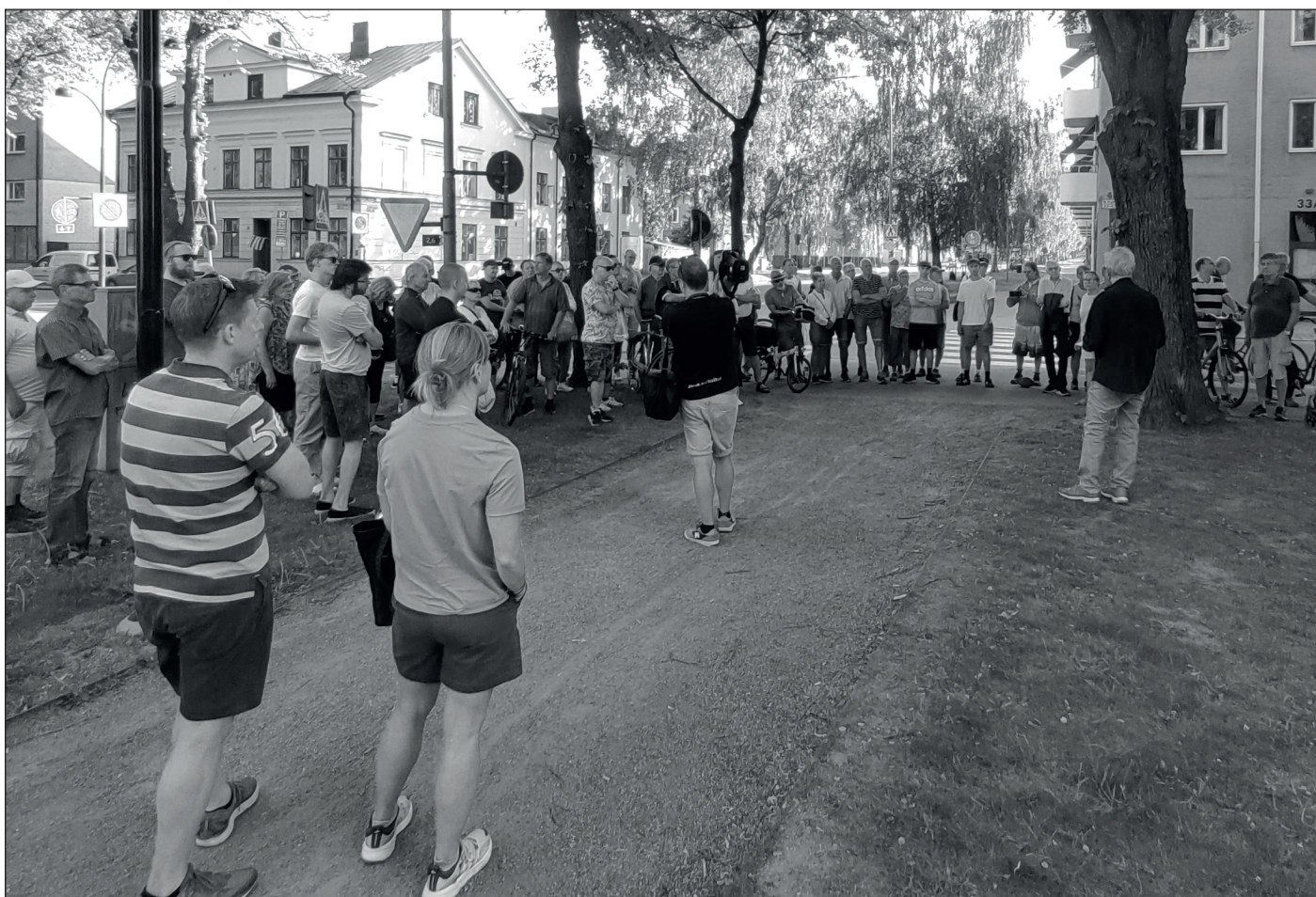
Mellan 80 och 90 personer vandrade från stadshuset till Strömvallen och hörde på när jag berättade om personer och händelser i Gefle IF:s historia.