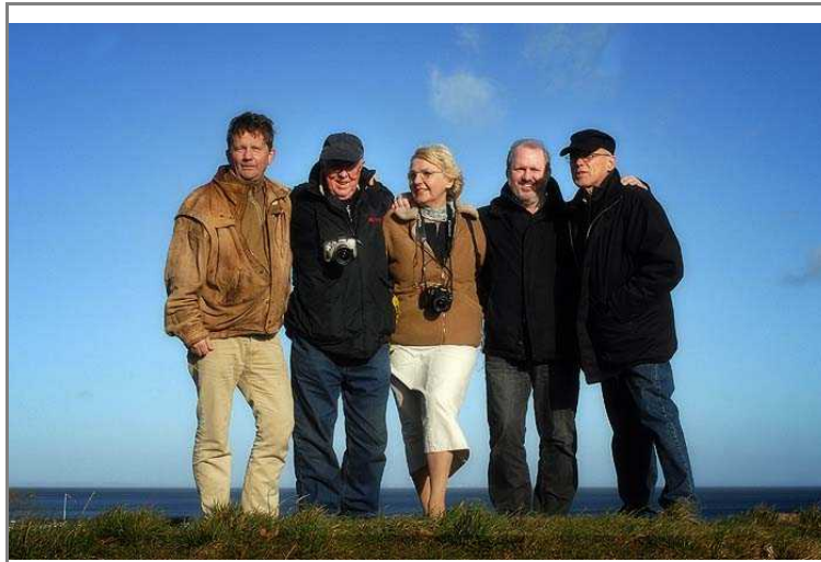
Obligatorisk gruppbild.

Första lördagen i november reste fyra panare och en före detta längs en solig Kattegatt-kust ner till Öresund och den danska huvudstaden (jo, vi reste faktiskt alldeles för långt, förblindade av skönheten längs kustvägen till Köpenhamn). Felnavigeringen blev lyckad, eftersom vi fick uppleva det gamla fortet Charlottenlund, strax norr om stan. Sevärt och mycket vackert i det otroliga novembervädret. Målet för resan var annars Louisiana, som vi numer vet ligger i Humlebaek, alldeles söder om Helsingör.