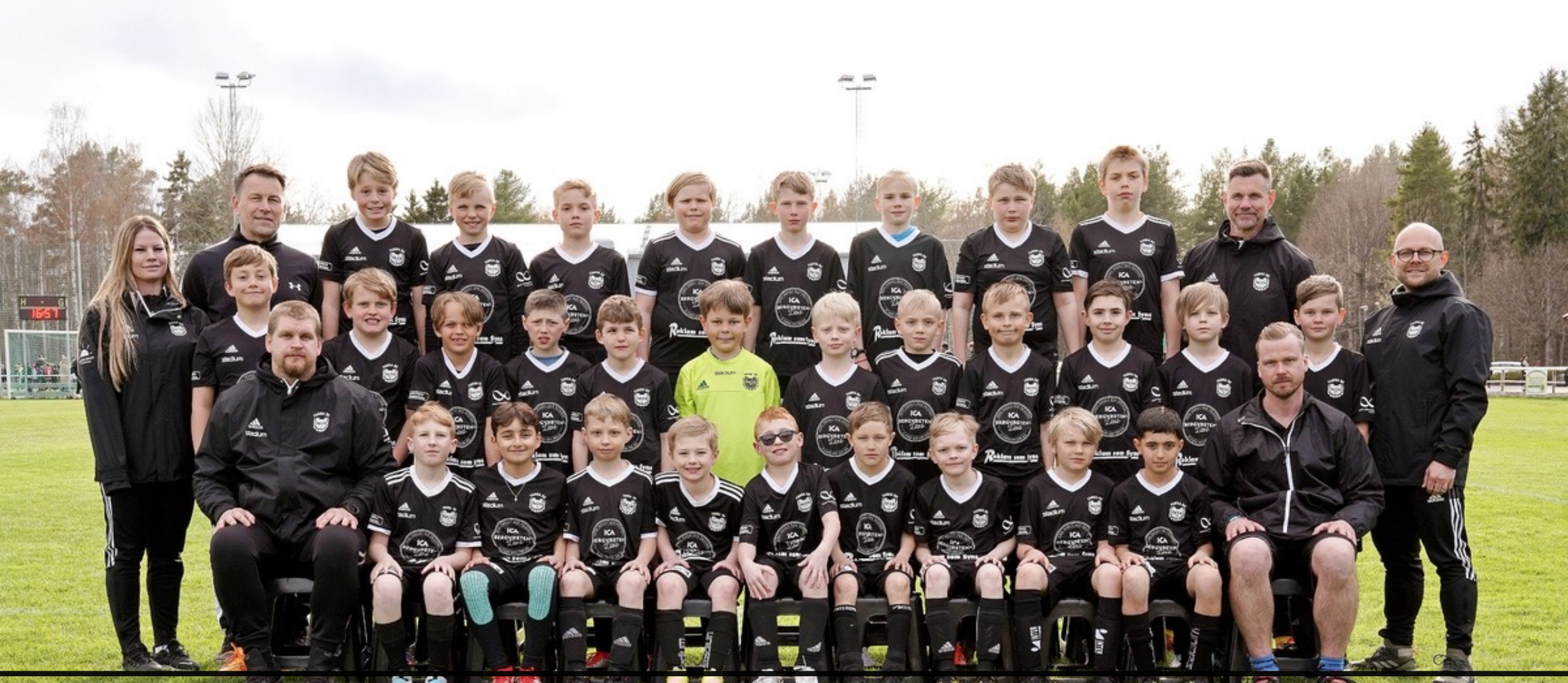
Laget i maj - 2023