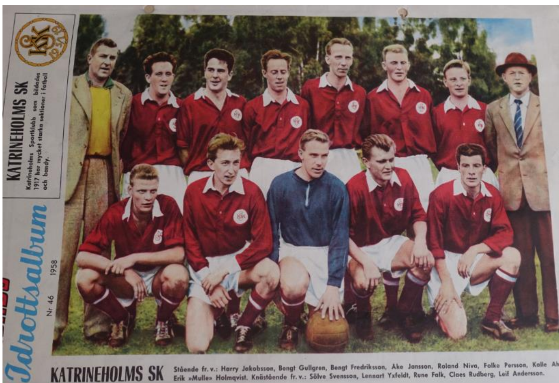
KSK på baksidan av Rekordmagasinet 1958. Åke fyra från vänster i övre raden.