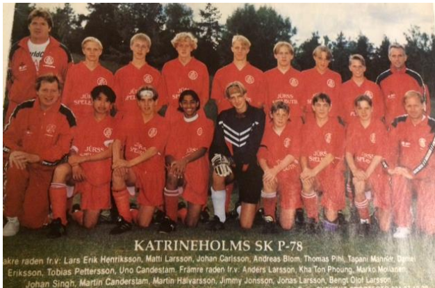
Martins generation med spelare födda -78 rönt stora framgångar på planen.