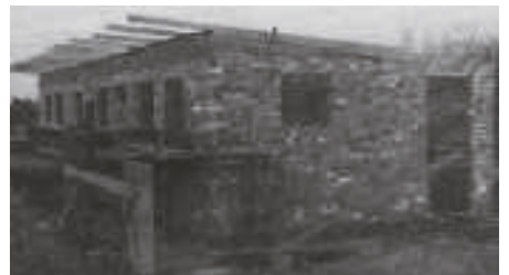
Första omklädningsrummen vid Danelid under uppförande

Äntligen kunde den nya idrottsplatsen Danelid invigas den 5 juli 1959. Genom mycket frivilligt arbete kunde den före detta Iergropen vid Bergsbrunna förvandlas till en fin idrottsplats och det blev ny fart inom Danmarks IF.