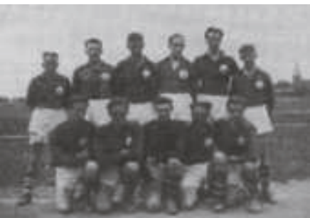
Ett stolt A-lag vid Gamla planen

Vi fick arrendera mark av Danmarks Prästgård och anlade en fotbollsplan som gick under namnet Gropvallen, där vi spelade våra matcher i 20 år.