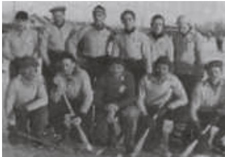
Ett stolt bandylag.

Serieseger för fotbollslaget i Uppsalaseriens klass II. Bandy togs upp på föreningens program.